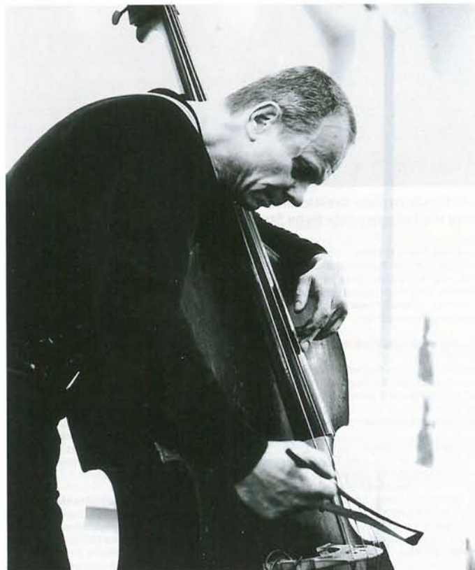
Die Peter Kowald Discography enthält alle 143 bis zum Jahr 2014 öffentlich gemachten Tonträger des Bassisten